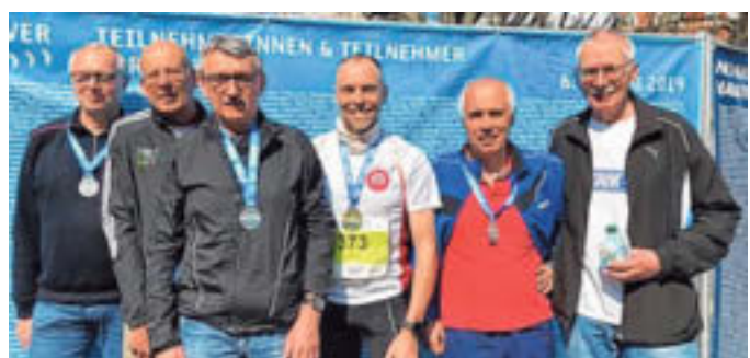
Mit Medaillen: Die Läufer aus Enger konnten mit ihren Leistungen beim Marathon Hannover zufrieden sein.

Stunden und belegte in der AK 50 den 106. Platz. Es waren insgesamt knapp 27.000 Läufer am Start.